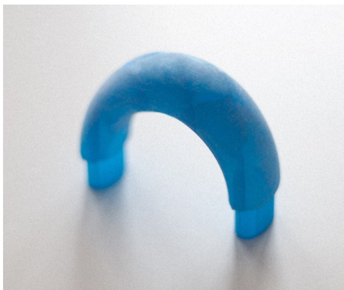
Figura 3. Fabricación aditiva. Asa impresa. Manises.

John Dewey, pedagogo, autor de obras como El arte como experiencia , trabajo en el que defiende que el medio de expresión en el arte no es ni objetivo ni subjetivo, es la