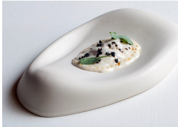
Figura 8. Plato de porcelana. Restaurante Ricard Camarena Bombas Gens Centre d'Art. València.