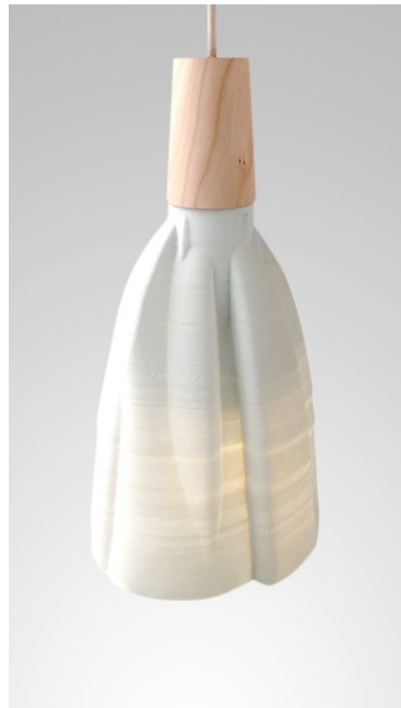
Figura 9. Y. Ruiz, Lámpara de porcelana. Manises.

Por último, quiero remitir al artículo de Katie Bunnell (2004) que tanto ha contribuido a configurar nuestra línea de pensamiento. En su texto, subraya el cambio de paradigma