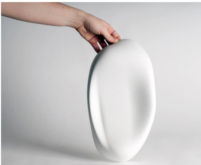
Figura 7. Modelo de microescayola. Manises.