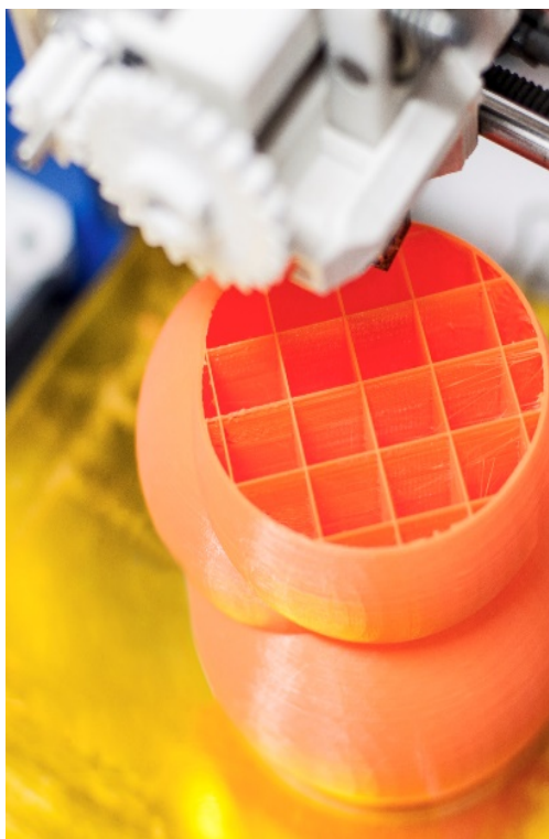
Figura 2. Impresora Prusa con hilo de plástico. Manises.

Zygmunt Bauman, sociólogo, filósofo y ensayista, conocido por sus escritos sobre la modernidad líquida . Sin embargo, a nosotros nos resulta más interesante el texto Retrotopía (2017), del que el periódico El País publicó varios fragmentos en su sección de cultura bajo el título Cinco formas de explicar a Zygmunt Bauman y nueve frases memorables , donde Bauman habla de replantearse el concepto de felicidad: «Hemos olvidado el amor, la amistad, los sentimientos, el trabajo bien hecho. (...) El viejo límite sagrado entre el horario laboral y el tiempo personal ha desaparecido. Estamos permanentemente disponibles, siempre en el puesto de trabajo.»