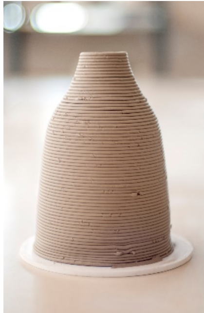
Figura 5. Jarrón Impreso. Manises.

resolver los problemas presentes ya no pueden comprometer el futuro de las generaciones que nos sucedan.