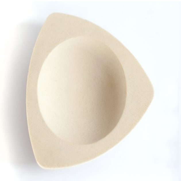
Figura 1. Fabricación aditiva. Primer plato en microescayola. Sodeintec Aldaya.

En el aula hemos sentido la necesidad de referirnos a sociólogos y ensayistas para entender esta nueva realidad. Entre ellos, citamos a Richard Sennett, sociólogo pragmático. De él nos interesa el concepto que vierte en El artesano (2008), que se resume con la idea de la «necesidad del trabajo bien hecho». Para entender esta afirmación es necesario saber que el pragmatismo trata de unir la filosofía con la experiencia. De hecho, no deberíamos olvidar el texto de la conferencia Artesanía, tecnología y nuevas formas de trabajo , ofrecida por Sennett en 2009 en el Centro de Cultura Contemporánea de Barcelona, en el que afirma que «cuando separamos la actividad práctica de la actividad intelectual, el que sale perdiendo es el ámbito intelectual, el ámbito del análisis y la comprensión». Sennett trata de poner en valor algo tan denostado por el neoliberalismo como es el oficio y la experiencia.