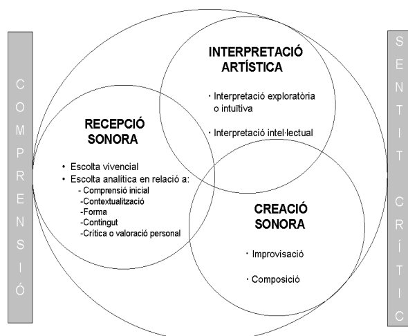
Figura 2. Esquema de les dimensions per a la comprensió i la construcció del sentit crític en música i poesia

D'entrada comentarem breument l'esquema i en mostrarem la justificació i l'articulació a nivell teòric per després exemplificar-ho mitjançant una aplicació concreta.