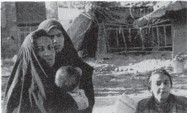
Mujeres con sus hijos, ante un edificio destruido el día 3 en el sur de Irak.