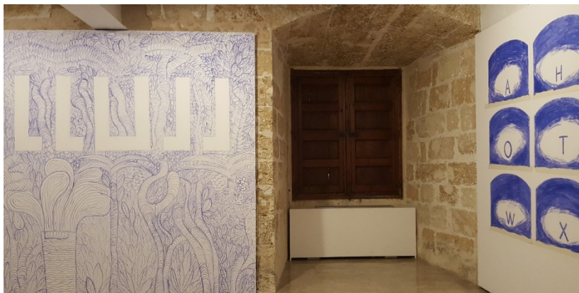
Figura 9. Murals dedicats a Lull, realitzats expressament a les parets de Casal Solleric.