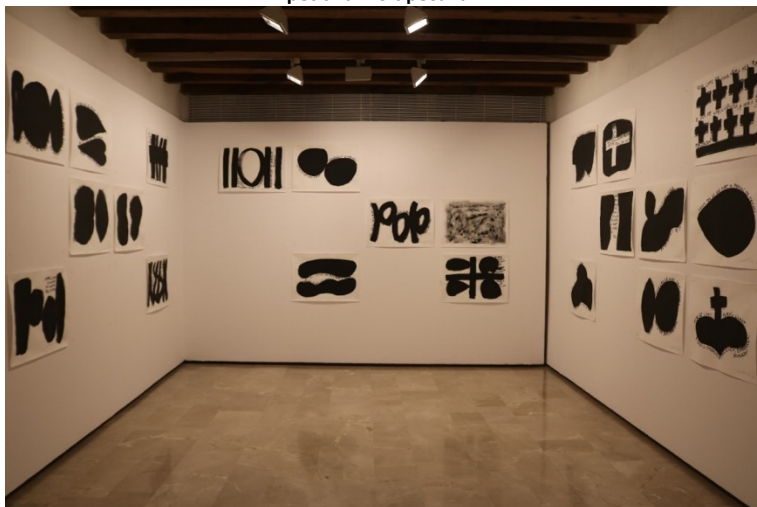
Figura 7. Espai dedicat a la sèrie de pintures amb frases de Lull, del Llibre d'amic e amat , referides al tema de la mort. La disposició remarca el ritme visual de les làpides al cementiri, una pauta repetitiva molt peculiar.