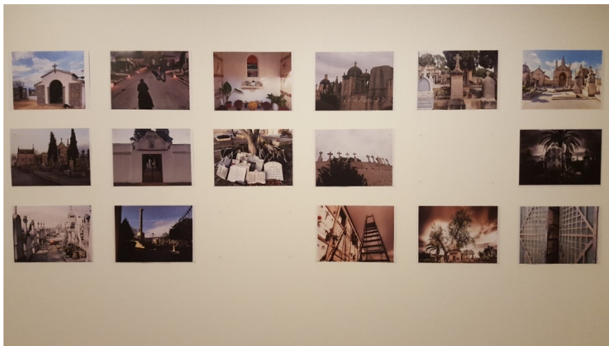
Figura 8. Un dels murs de l'exposició dedicats a les fotografies de l'alumnat. Per ordenar les imatges s'estableix la pauta repetitiva de l'ordenació dels nínxols a les parets del cementiri