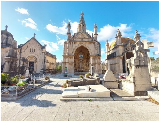
Figura 4. Tombes i panteons al Cementiri de Palma