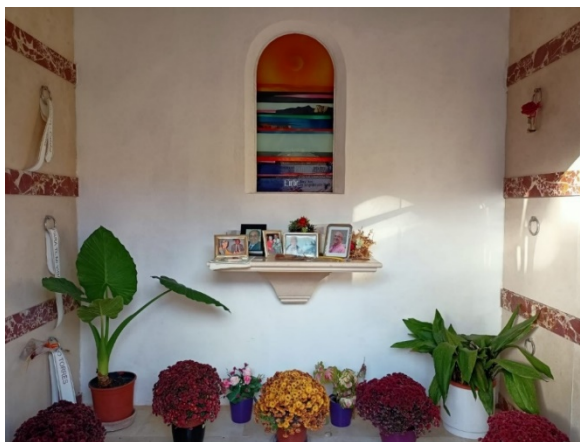
Figura 3. Cementiri de Valldemossa