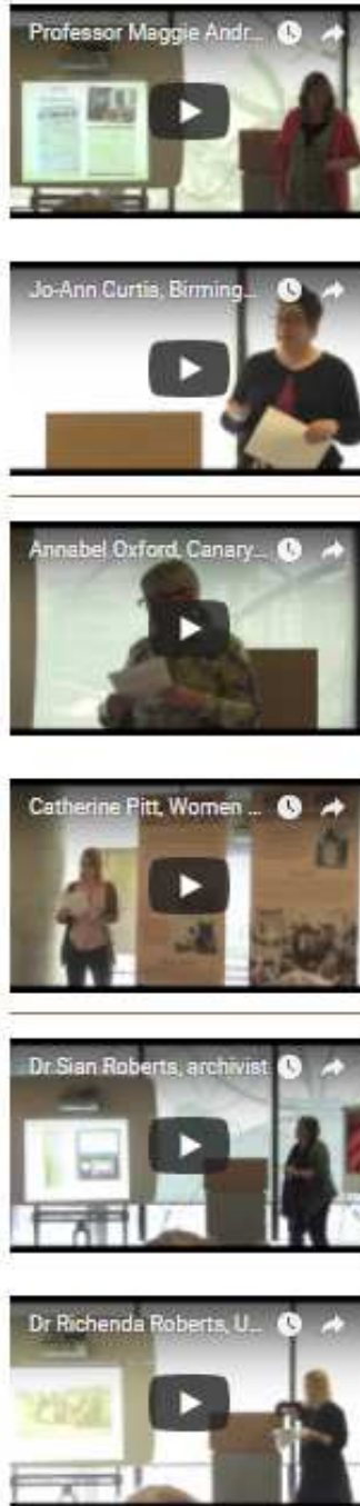
Figura 4. Reproducció de diferents moments dels «Study days»