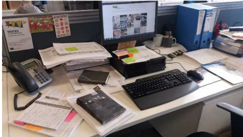
Figura 3. Espai de treball a la Library of Birmingham