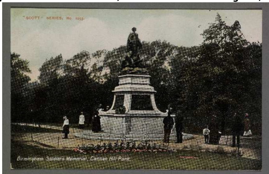
Figura 1. Boer War Memorial, Cannon Hill Park. Birmingham, 1906

Reproduïda amb el permís de Birmingham Museums Trust – Birmingham Museum & Art Gallery, Chamberlain Square, Birmingham B3 3DH.