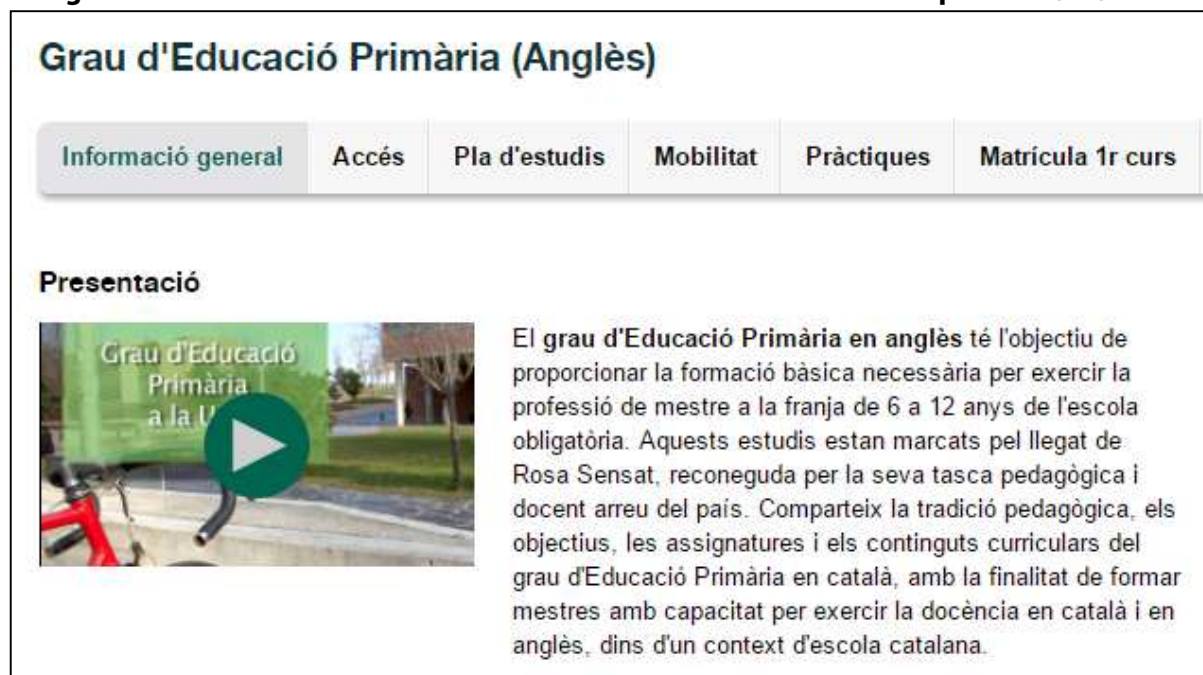
Figura 1. Informació del Web institucional del GEP-DUA. Data de la captura: 17/05/2016

El disseny i encetament del GEP-DUA es va fer sobre els següents tres supòsits: els estudiants GEP-DUA (a) millorarien el seu anglès; (b) mostrarien uns índexs de rendiment similar al dels estudiants que segueixen el programa estàndard en català, tant a les assignatures cursades en anglès com a les cursades en català, i (c) en estadis avançats del programa (3r curs), mostrarien un nivell de competència lingüística en català similar al dels estudiants que van cursar el programa estàndard en català. Els trets específics del GEP-DUA es presenten en les tres seccions que desenvolupem a continuació.