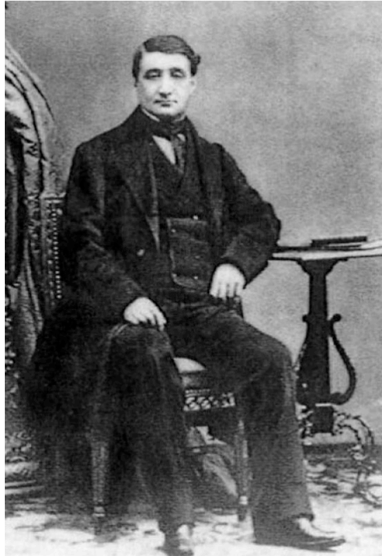
Louis-Lucien BONAPARTE (1813-1891)