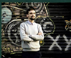
Premi Crítica «Serra d'Or» de Traducció 2020 EUGENI ONEGUIN d'Aleksandr Puixkin d'Arnau Barrios