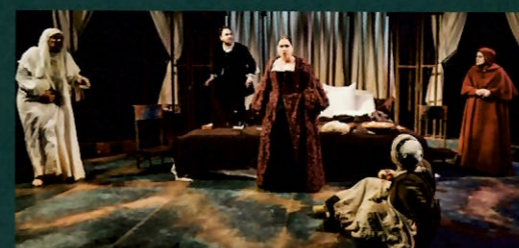
Premi Crítica «Serra d'Or» de Teatre 2020 a l'aportació més interessant a la companyia LA CALÒRICA per mantenir-se fidel durant deu anys a una personalitat pròpia amb el permanent acompanyament de l'autoria singular de Joan Yago