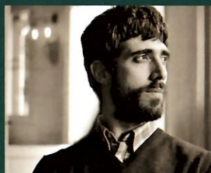
Premi Crítica «Serra d'Or» de Narrativa 2020 EL PAÍS DELS CECS de Víctor García Tur