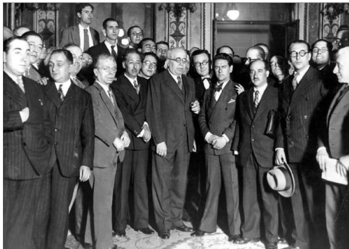
Azaña, un cop acabat de pronunciar a les Corts el seu discurs sobre l'Estatut català, amb Companys, el maig de 1932. A sota, cartell i manual reproduïts al llibre.

Dos anys més tard, el 1932, les Corts van aprovar l'Estatut de Catalunya (el text del qual també es recull al llibre). Del debat parlamentari apareixen destacades les intervencions d'Azaña i de Lluís Companys, dirigent d'Esquerra Republicana, defensant el projecte de l'Estatut. No s'hi inclou, però, el cèlebre discurs en contra del filòsof i aleshores diputat José Ortega y Gasset. La intervenció d'Ortega i la rèplica d'Azaña són cares de la mateixa moneda,