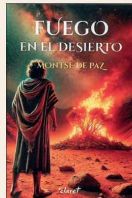
MONTSE DE PAZ Fuego en el desierto Editorial Claret, 2025, 600 pàg.

L'autor, partint dels textos de la Sagrada Escripura i dels escrits i les biografies de sant Francesc d'Assís, estudia la relació i dependència del Poverello de Jesús, tot palesant les seves nombroses similituds.