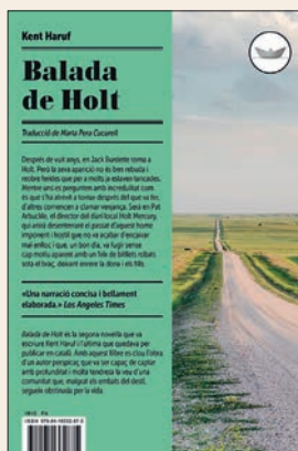
KENT HARUF Balada de Holt Edicions del Periscopi, 2025, 216 pàg.

Aquesta novel·la uneix la història, documentada amb rigor, i la revelació bíblica en un missatge sempre actual. Una reinterpretació de l'alliberament del poble hebreu a l'antic Egipte, que se centra en el personatge de Moisès.