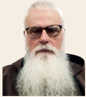
FRA VALENTÍ SERRA DE MANRESA Caputxí

S'han publicat les actes de l'onzè Col·loqui d'Història Antiga, celebrat a Saragossa els dies 9 i 10 de setembre del 2021, on s'aborda l'estudi d'una temàtica d'enorme interès per als reptes que ha d'afrontar l'Església i el món actual: la pobresa. Avui ens preocupen molt les desigualtats entre pobles i nacions, però no podem pas oblidar que també existí la desigualtat i la pobresa a l'antiguitat, que va afectar amplis sectors de la societat.