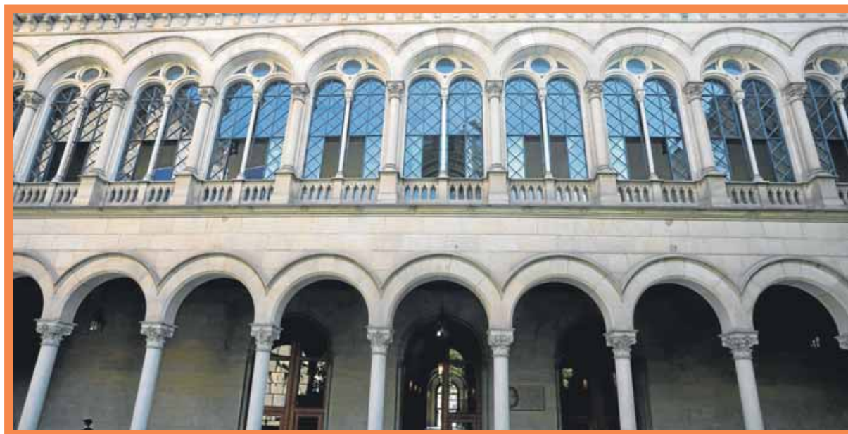
L'edifici històric de la Universitat de Barcelona ⇨ ORIOL DURAN