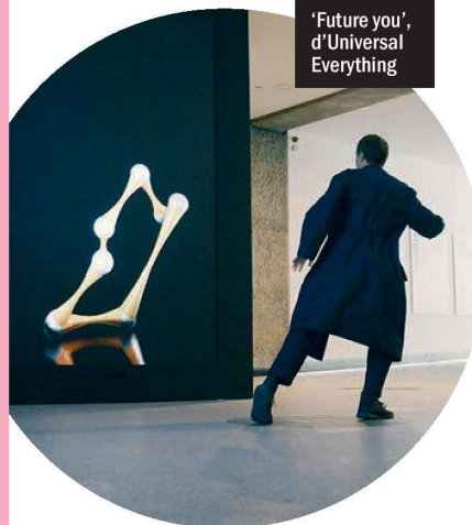
'Future you', d'Universal Everything

→ Disseny Hub Barcelona. Del 27 d'abril al 27 d'agost. 13 €.