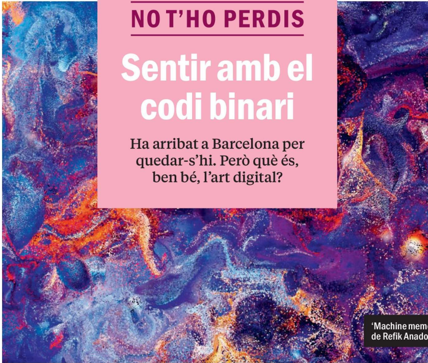
'Machine memoirs', de Refik Anadol

Ha arribat a Barcelona per quedar-s'hi. Però què és, ben bé, l'art digital?