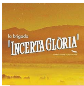
INCERTA GLÒRIA La Brigada