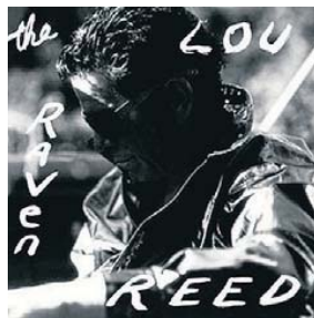
THE RAVEN Lou Reed

B ruce Springsteen explica al llibre de memòries Born to run que quan va començar a compondre sobre el que seria el disc Nebraska (1982) guiaven la seva imaginació músics com Bob Dylan, Woody Guthrie i Hank Williams, les pel·lícules de Terrence Malick, el film La nit del caçador de Charles Laughton, les novel·les negres de James M. Cain i els contes d'estil gòtic nord-americà de Flannery O'Connor, l'autora de The river , el relat que després convertiria en cançó PJ Harvey. El cinema i la literatura, doncs, han marcat notablement l'obra de Springsteen, que es va inspirar en el protagonista de la novel·la El raïm de la ira (1939) de John Steinbeck per titular el disc The ghost of Tom Joad (1995). El mateix músic de Nova Jersey admet que havia arribat al llibre de Steinbeck a través de l'adaptació cinematogràfica que n'havia fet John Ford el 1940 i que tant l'havia influït durant la composició del disc Darkness on the edge of town (1978). En tot cas, Springsteen va estirar el fil de l'explotació de la classe treballadora i dels desposseïts que denunciava la novel·la per explicar el mateix, però en el context de desindustrialització i deslocalització dels anys 90. The ghost of Tom Joad , per tant, és un bon exemple d'adaptació musical d'un material l'origen del qual és literari. També ho són els deu discos que es comenten tot seguit.